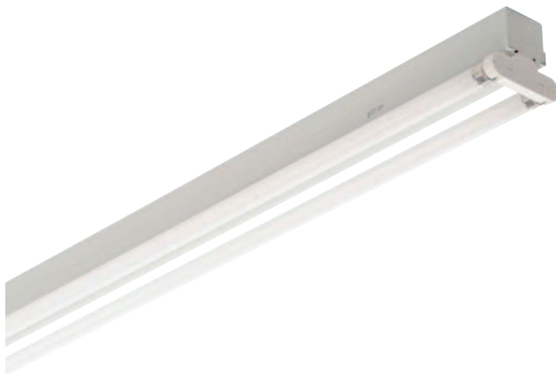
MIRO 149 HF