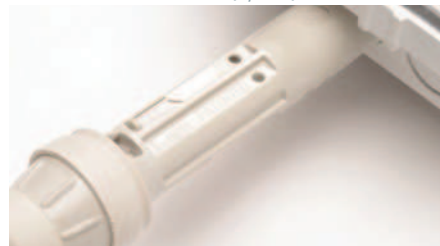
MPM® CRET 3 POLES IP65 (option)