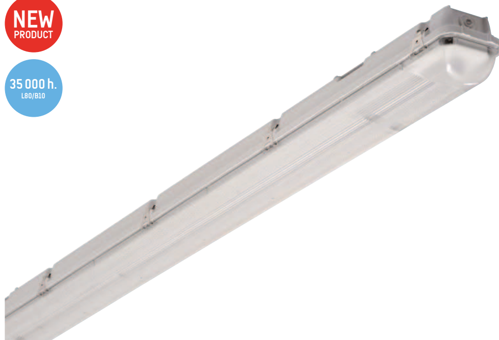
CITY ECOLED® LI550 2 7200/840 PMMA /